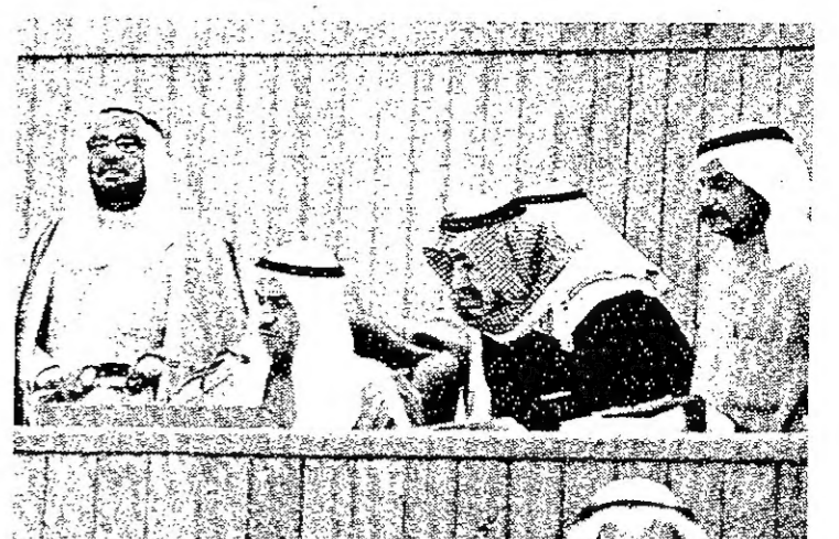
الرئيس قبل حلول موعد الجلسة محاطا بالنواب